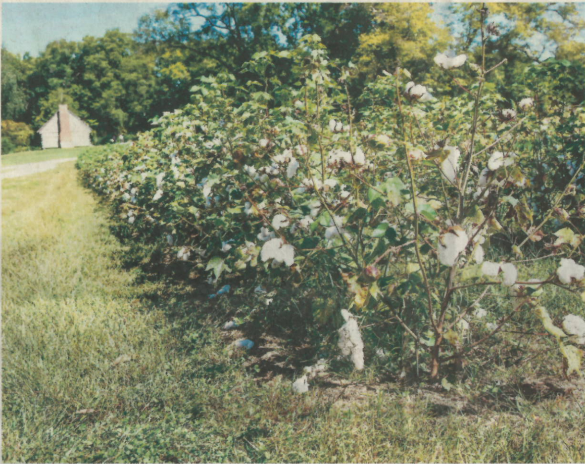
„Rond 1862 schafte Nederland als een van de laatste mogendheden ter wereld de slavernij af, zij het in etappes. Een jaar later zouden alle 33.000 Surinaamse slaven hun vrijheid krijgen.“ De katoenplantages in Suriname boetten gaandeweg aan belang in.